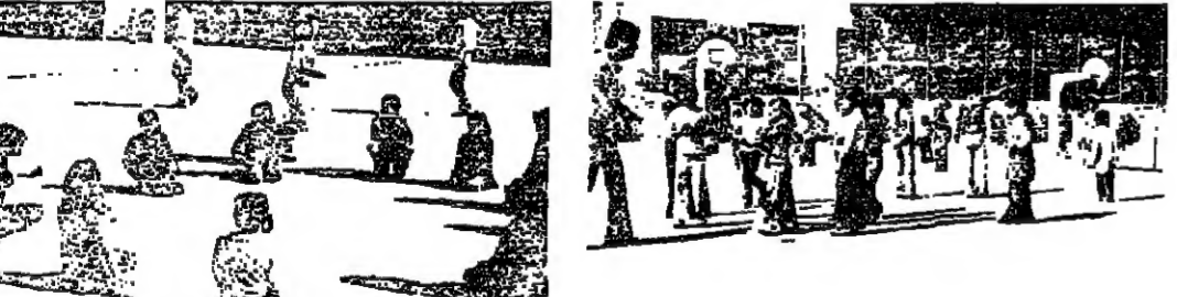
حلقه .. ولعبة ترفيهية